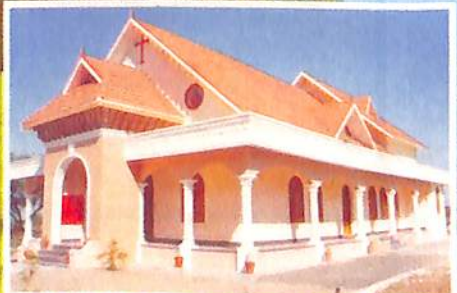
നാഗ്പൂർ സെമിനാരിയിൽ പുതുതായി പണിത ചാപ്പൽ

മെത്രാൻ തിരഞ്ഞെടുപ്പ് പ. സുനാപാറക്കുണ്ടി മാർച്ച് 2004